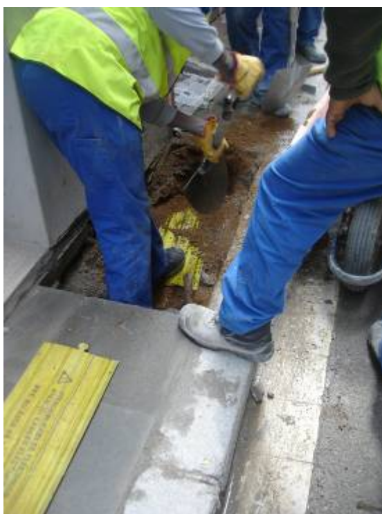
Foto 4: Excavació de la rasa on s'observa l'aparició del cablejat elèctric antic