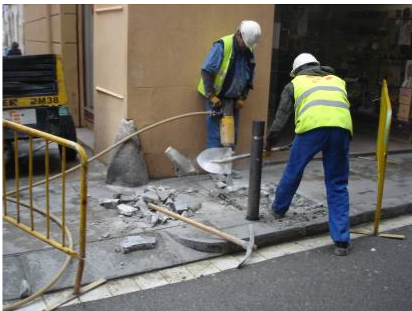
Foto 3: Treballs d'excavació de l'inici de la rasa davant la finca 66