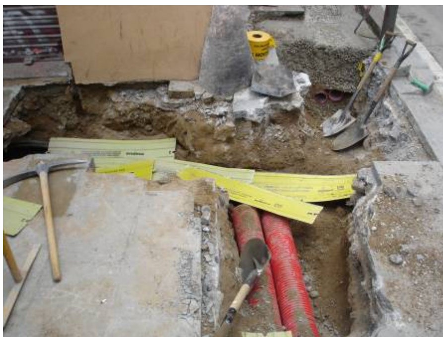
Foto 6: Vista del sondeig situat al C/ Jaume Giralt, perpendicular a la Rasa del C/ Sant Pere Més Baix