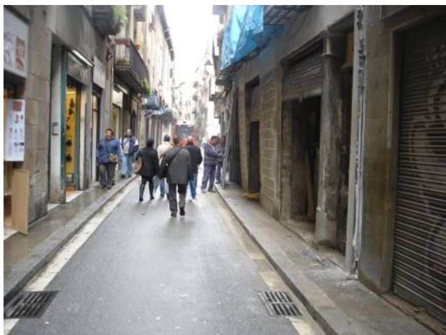
Foto 2: C/ Sant Pere Més Baix davant la finca 56, en direcció a C/ Jaume Giralt