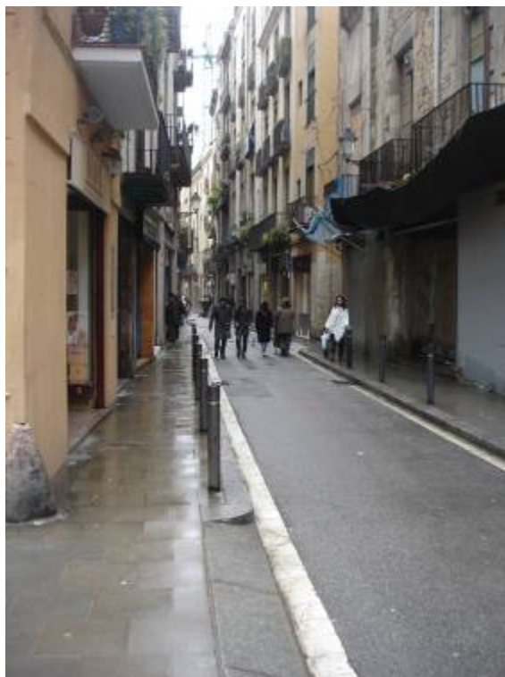
Foto 1: Vista general C/ Sant Pere Més Baix cantonada amb C/ Jaume Giralt